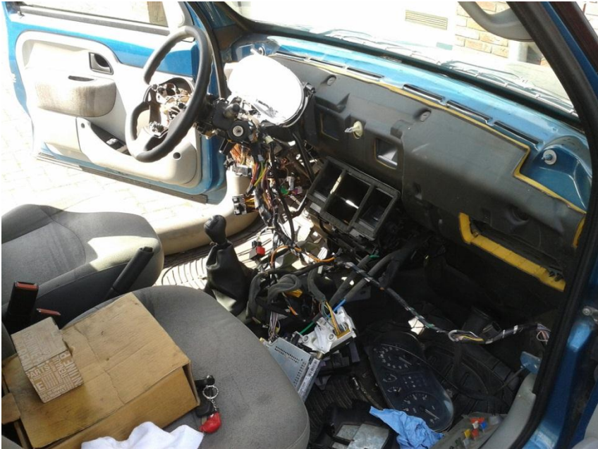
OKE zo kan het ook nog????

Er komen zo af en toe ook wel heel vreemde opdrachten binnen. Ook daar draaien de heren bij autobedrijf Bouwman de hand niet voor om.